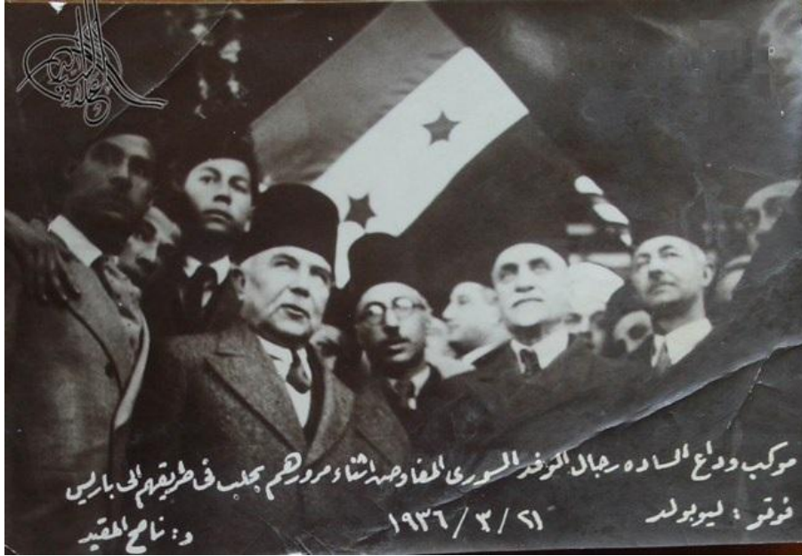
في وداع فارس الخوري رئيس الوفد السوري المفاوض على استقلال سوريا بحلب قبل توجهه إلى باريس