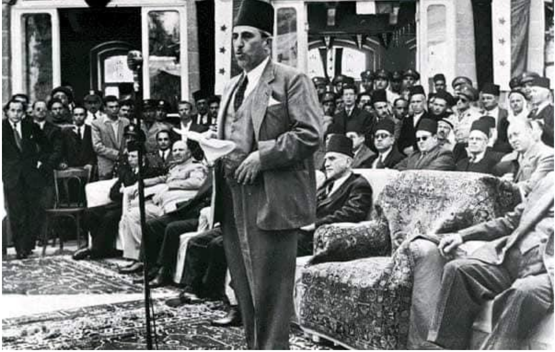
شكري القوتلي والعلم السوري