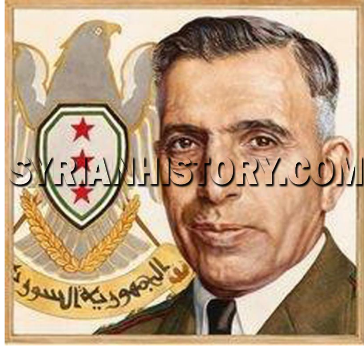
الرئيس أديب الشيشكلي في تموز 1953