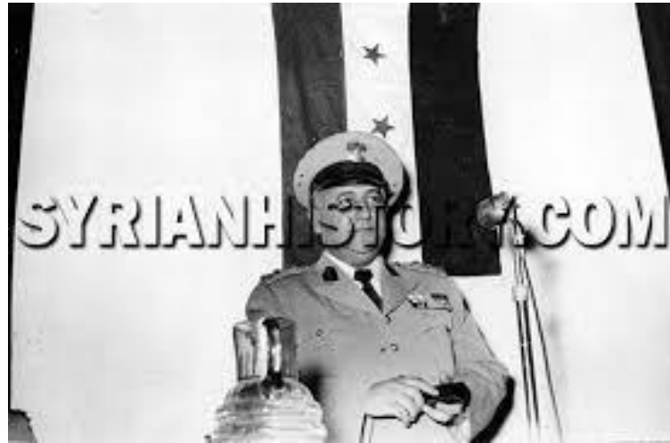
الرئيس السوري فوزي سلو خلال الفترة الممتدة من 3 كانون الأول 1951 إلى 11 تموز 1953 وخلفه العلم السوري الرسمي أو علم الاستقلال