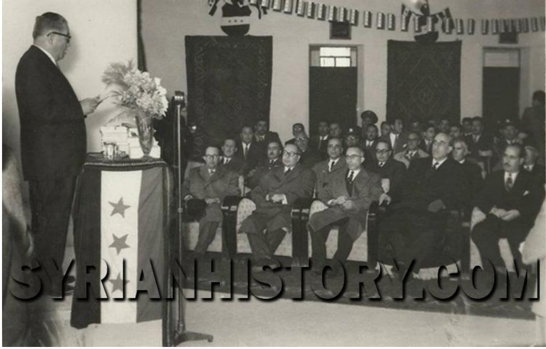
الرئيس شكري القوتلي في مناسبة رسمية عام 1956 الصف الأول من اليمين: أمين عام حزب الشعب علي بوظو، الرئيس شكري القوتلي، رئيس مجلس النواب ناظم القدسي، رئيس الحكومة الأسبق معروف الدواليبي،