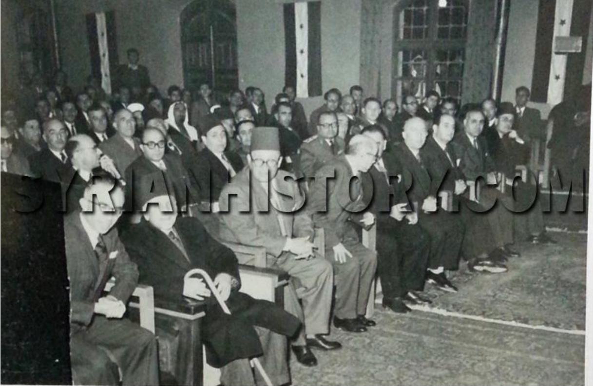
حفل وداع للرئيس هاشم الأتاسي قبل مغادرته الحكم عام 1955 وعلم الاستقلال زيّ الشمس!