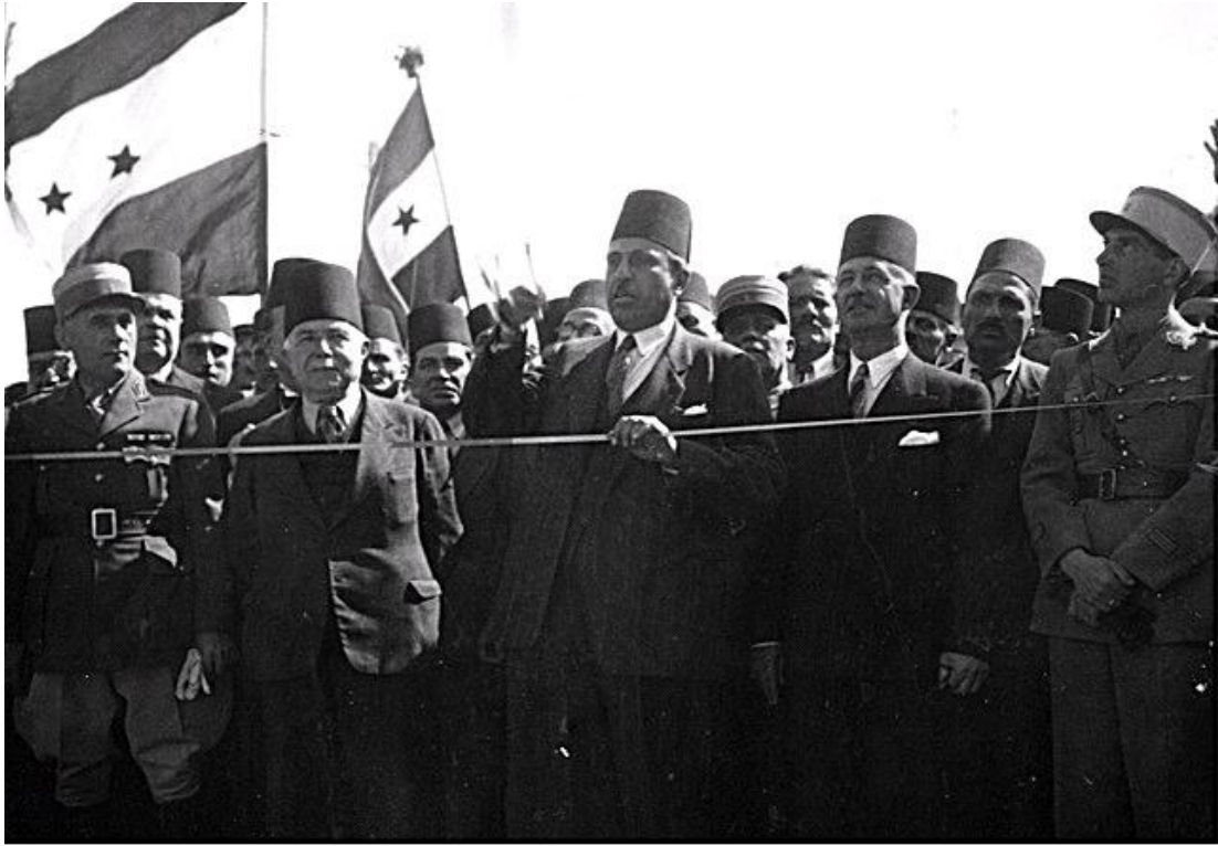
الرؤساء (من اليمين لليساار) سعدالله الجابري وشكري القوتلي وفارس الخوري في احتفالات الاستقلال