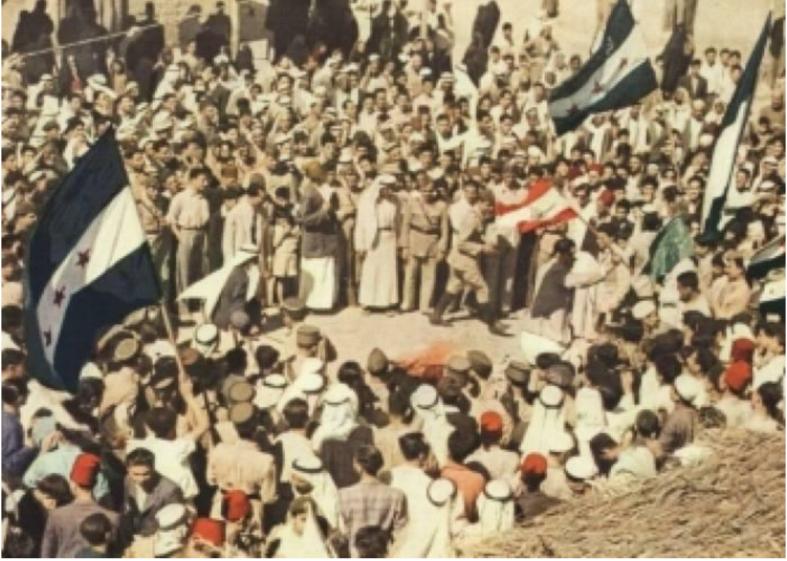
مظاهرة في دير الزور احتفالاً في الاستقلال عن الاحتلال الفرنسي