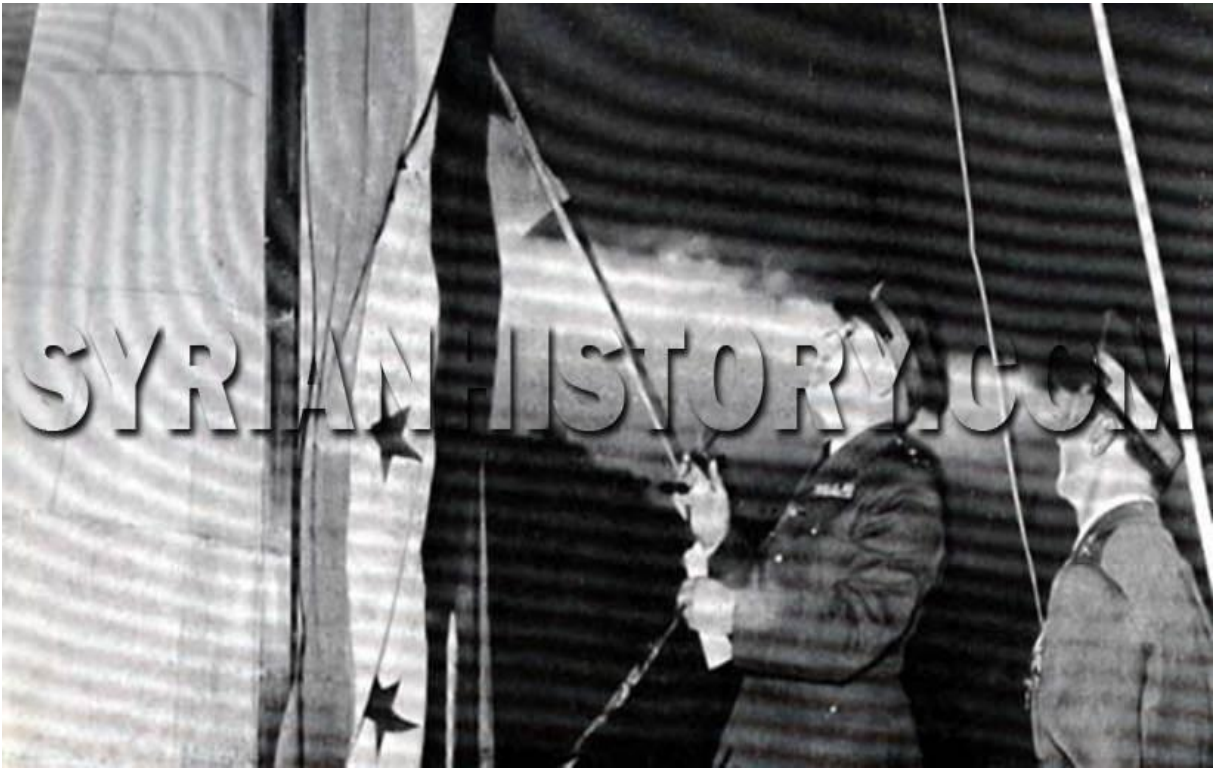
الرئيس أديب الشيشكلي يرفع العلم السوري يوم عيد الجلاء عام 1953