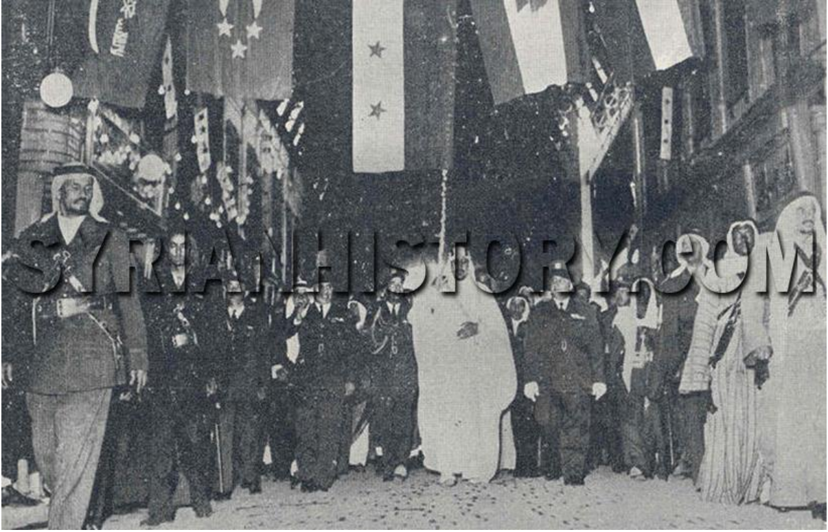
الرئيس أديب الشيشكلي وولي عهد السعودية الأمير سعود بن عبد العزيز في سوق الحمضية في دمشق عام 1952