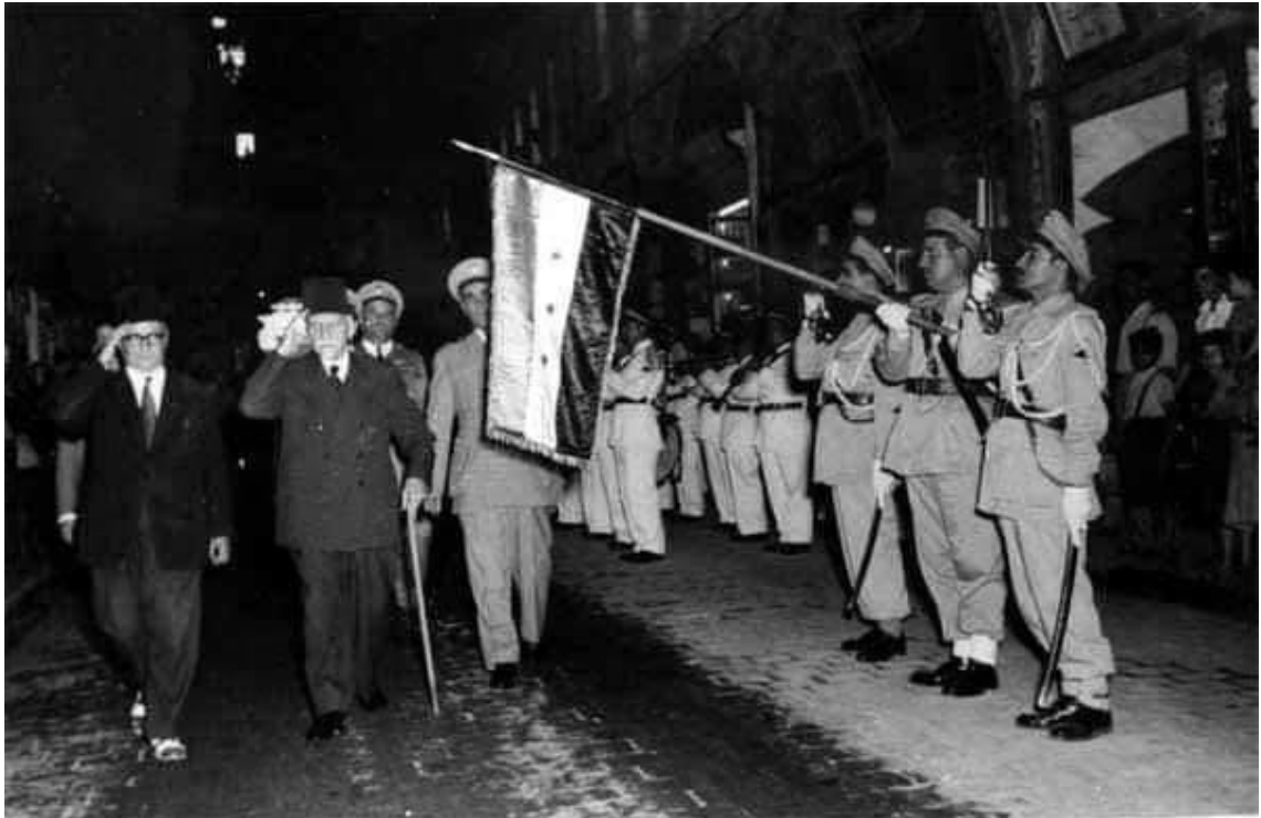
الرئيس الأتاسي في دمشق بعد يوم من سقوط عهد الرئيس أديب الشيشكلي عام 1954