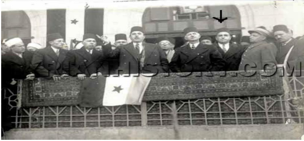
الرئيس شكري القوتلي يخاطب الجماهير في حلب عام 1944، الرابع من اليمين هو رئيس الحكومة سعد الله الجابري تحت السهم.