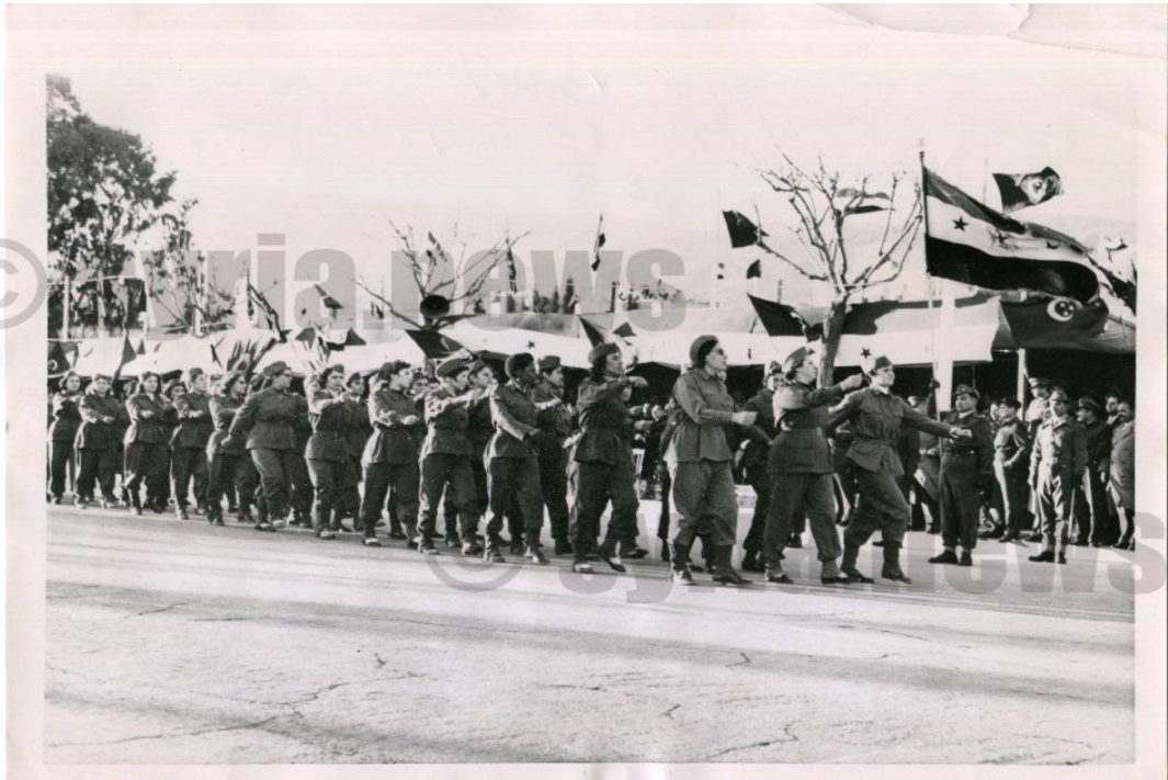
تستعد نساء من الجيش السوري لاستعراض عسكري (في ظلّ العلم الرسمي أو علم الاستقلال عن الاحتلال الفرنسي) سيجري امام الرئيس شكري القوتلي في 7 شباط ، بعدما وافقت سوريا على الدستور المؤقت للجمهورية العربية المتحدة وقبل أن يفرض عبد الناصر علمه على السوريين.