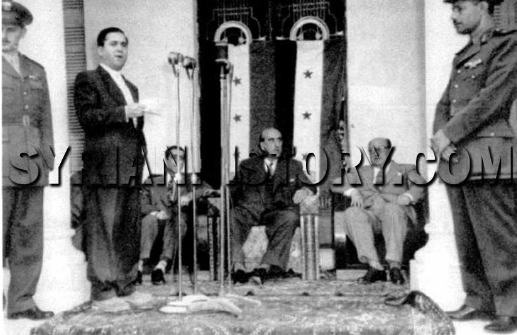
الرئيس شكري القوتلي في عيد الجلاء الحادي عشر يوم 16 نيسان 1957