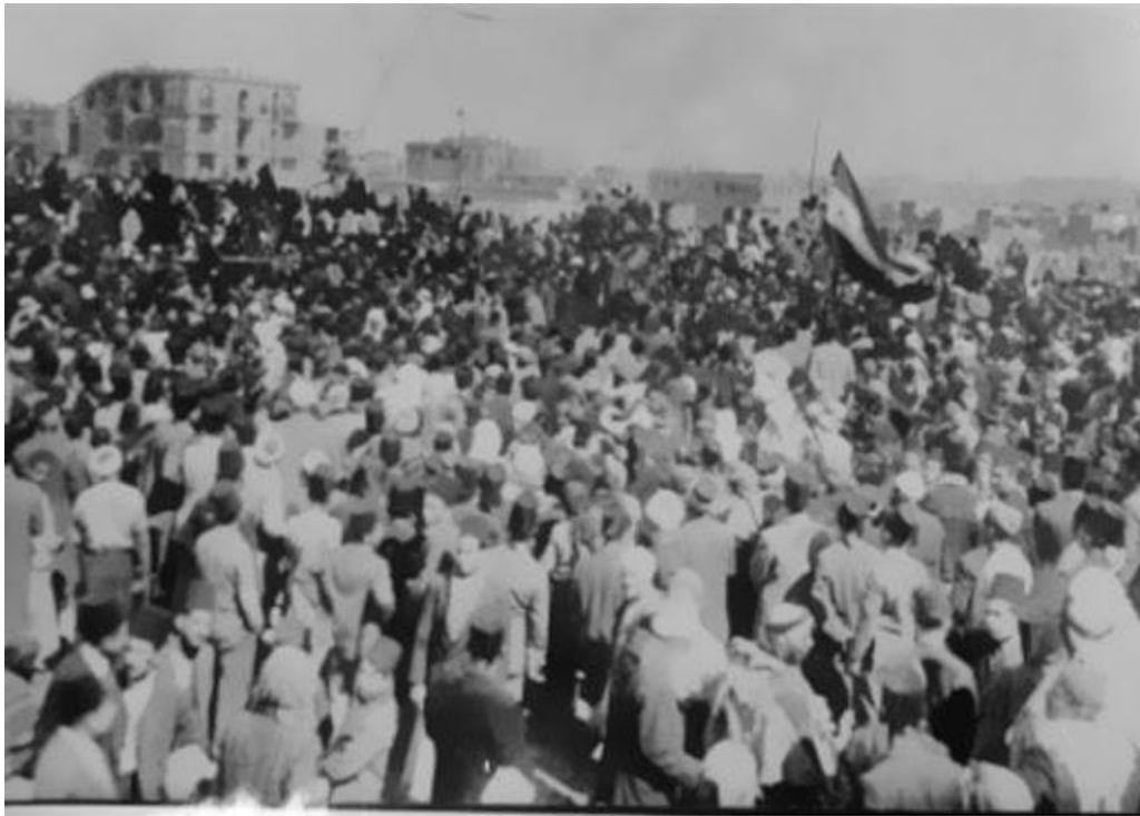
المظاهرات الجماهيرية المطالبة باستلام المصالح المشتركة من الانتداب الفرنسي و تشكيل الجيش الوطني . . في ساحة سعد الله الجابري في حلب