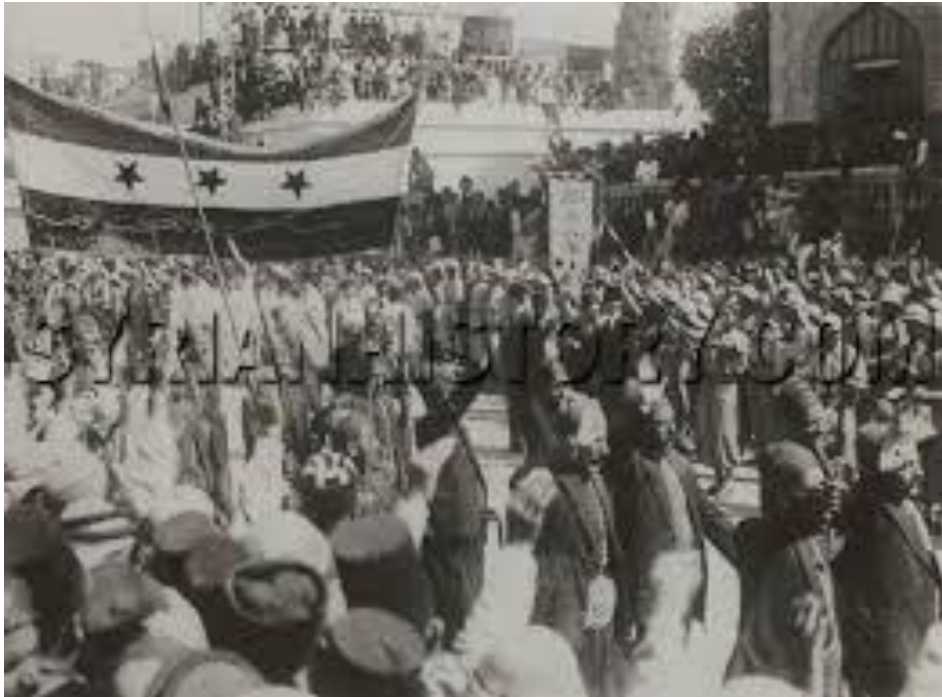
احتفال بعيد الاستقلال في دمشق .. معلومة غير مؤكدة بل تقديرية حول الصورة