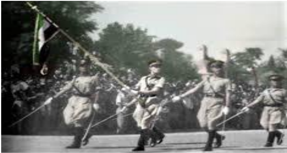
فرم الماتزم حنات الماتس لكف يحمل علم الاستقلال لأول مرة في العرض العسكري بمناسبة الجلاء بتاريخ 17 نيسان 1946