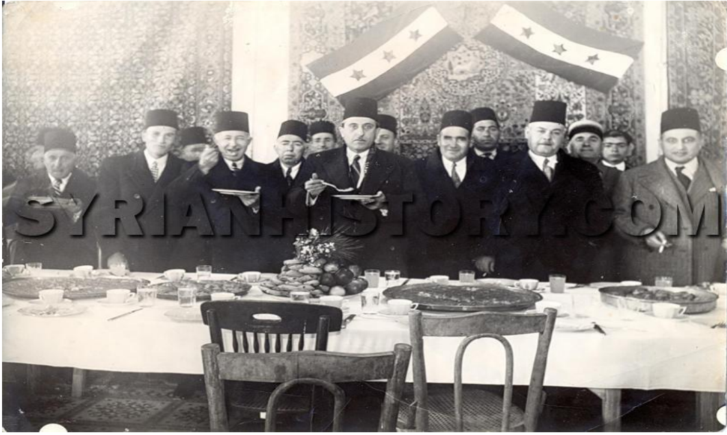
الرئيس شكري القوتلي في زيارة لمعرة النعمان خلال احتفالات عيد الجلاء الأول عام 1946