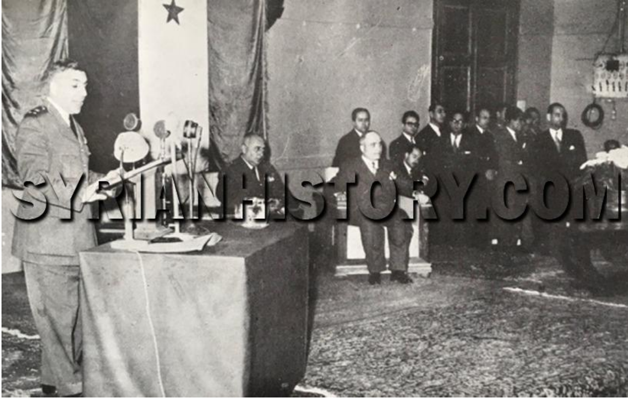
الرئيس أديب الشيشكلي عام 1953