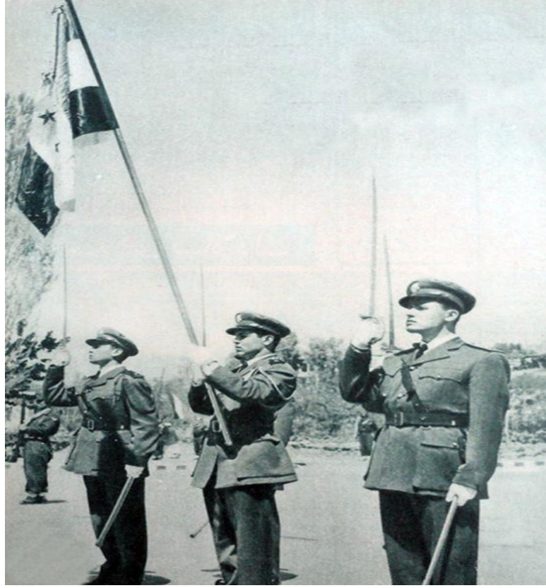
تطور الجيش السوري ودوره في مرحلة ما بعد الانقلابات 1954-1958