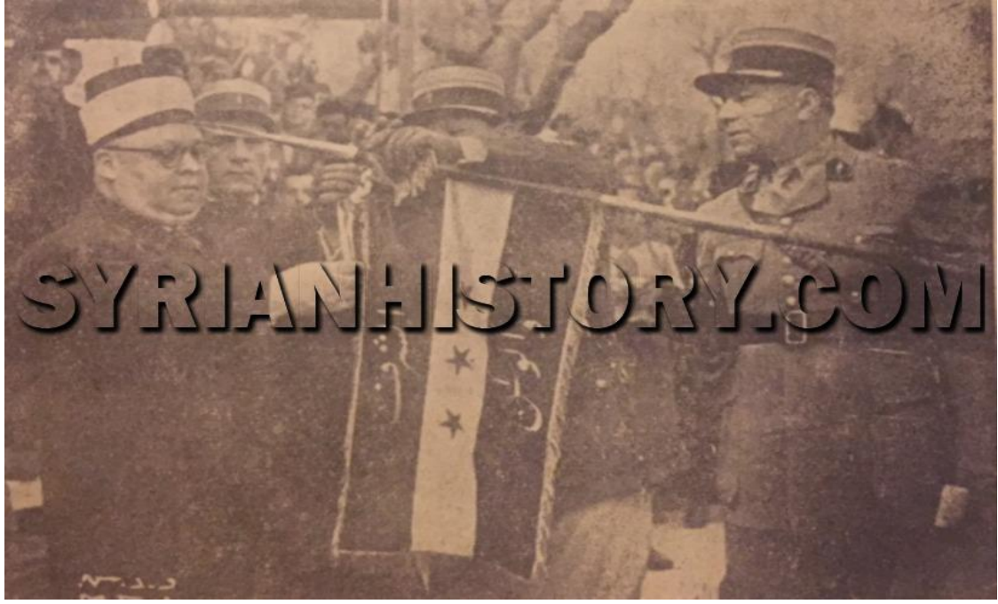
الرئيس الشيخ تاج الدين الحسني سنة 1942 والعلم السوري الرسمي في المقدمة