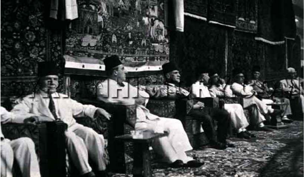
الكتلة الوطنية بعد انتخابات عام 1943

من اليسار: رئيس مجلس النواب فارس الخوري - الرئيس القوتلي - الرئيس الأسبق هاشم الأتاسي - رئيس الوزارة سعد الله الجابري - وزير الخارجية جميل مردم بك - وزير الداخلية لطفي الحفار. طبعا علم الاستقلال حاضر.