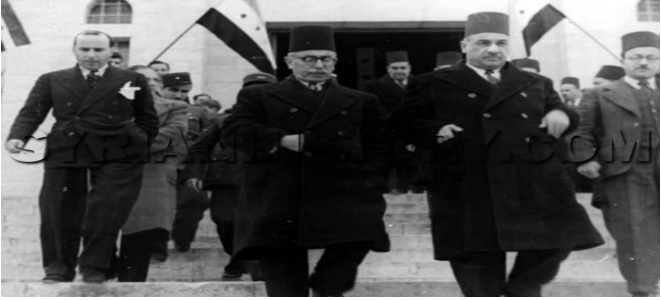
دولة الرئيس جميل الإلشي (وسط) مع وزير الاقتصاد محمد العايش (الثاني من اليمين) في كانون الثاني عام 1943. يظهر في اليسار الدكتور منير العجلاني صهر الرئيس تاج الدين الحسني ووزير الشباب في حكومة الإلشي