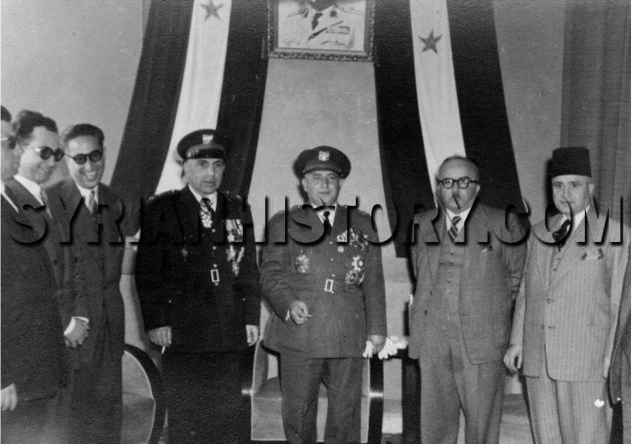
رئيس الدولة الزعيم فوزي سلو وقائد الانقلاب السوري الثالث العقيد أديب الشيشكلي في تشرين الثاني 1952 وعلم الاستقلال واضح في الخلف.