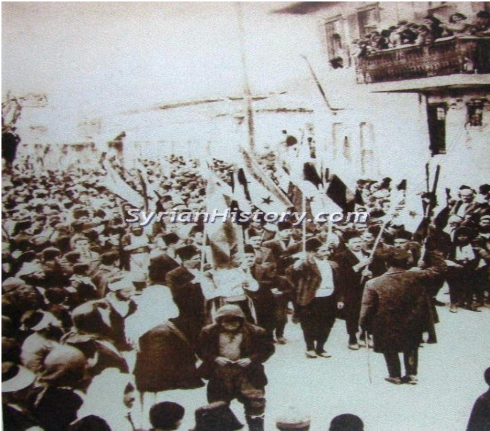
مظاهرة في دمشق 1936