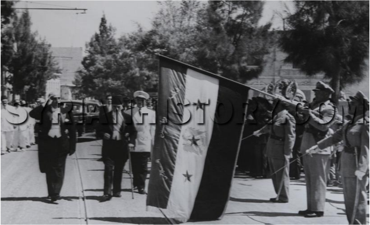
الرئيس المنتخب شكري القوتلي والرئيس المنتهية ولايته هاشم الأتاسي على أبواب المجلس النيابي عام 1955 والعلم في المقدمة هذه المرّة