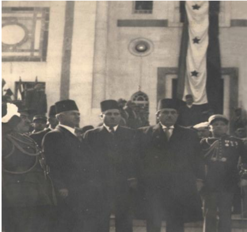
من اليمين شكري القوتلي رئيس الجمهورية، سعيد إسحق نائب رئيس مجلس النواب، سعد الله الجابري رئيس مجلس النواب