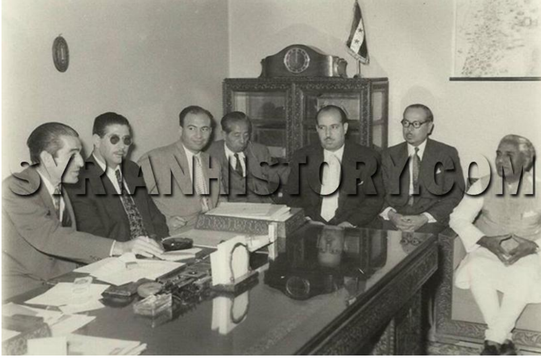
رئيس مجلس النواب أكرم الحوراني في مكتبه عام 1957 يجلس أمام الرئيس الحوراني كل من أمين عام حزب الشعب علي بوظو ورئيس الحكومة الأسبق الدكتور معروف الدواليبي .. طبعا العلم السوري واضح المعالم