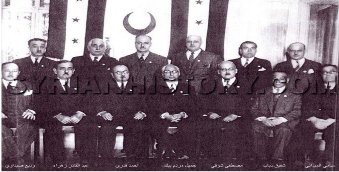
منظمة الهلال الأحمر - دمشق 1946 من اليمين: الأستاذ سامي الميداني رئيس جامعة دمشق - شفيق دياب - الدكتور مصطفى شوقي - رئيس المنظمة دولة رئيس الحكومة جميل مردم بك - الدكتور احمد قنري - عبد القادر زهراء - الصحفي وديع صيداوي صاحب جريدة الناس-