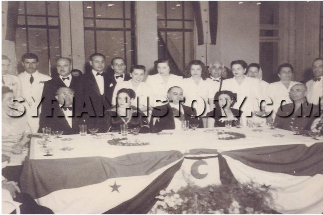
الرئيس حسني الزعيم في عشاء خيري للهلال الأحمر في فندق بلودان قبل مقتله بساعات يوم 14 آب 1949

من اليمين: السيدة الأولى نوران الزعيم - الرئيس حسني الزعيم - حرم الرئيس محسن البرازي - دولة الرئيس محسن البرازي. تقف خلف زوجة الزعيم رئيسة الهلال الأحمر السيدة قمر قزوعون شوري