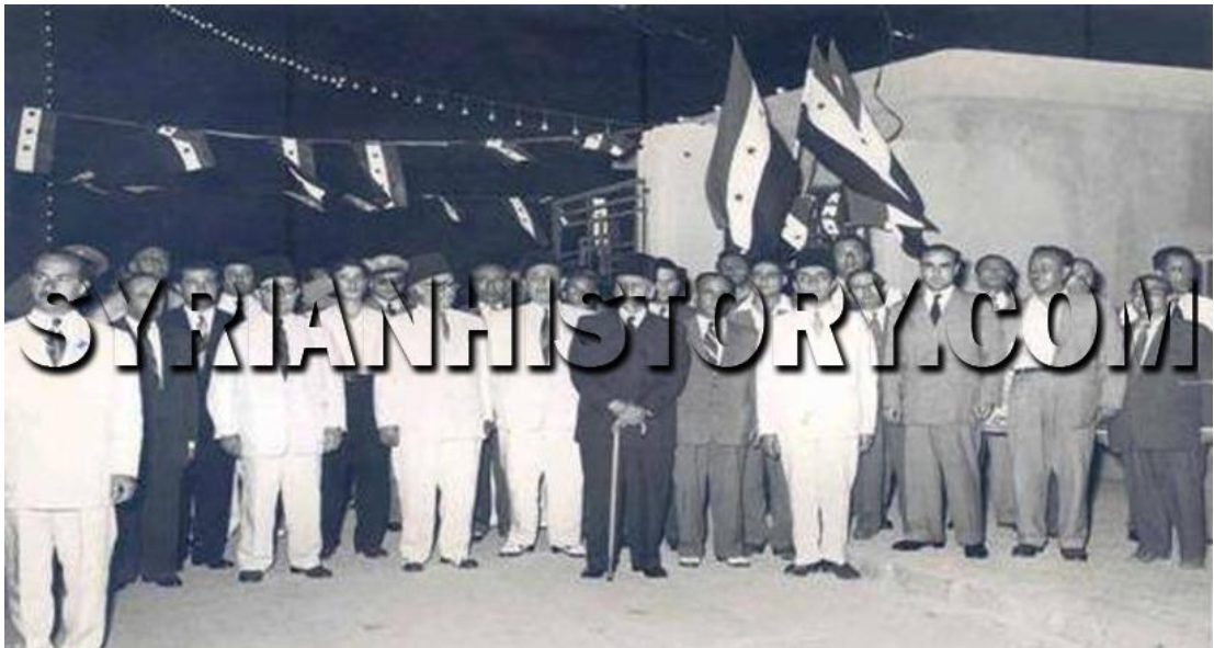
الرئيس هاشم الأتاسي في افتتاح مستشفى المجتهد بدمشق عام 1955 وأعلام الاستقلال واضحة جداً